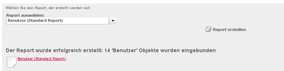
Abbildung 4: Ergebnisanzeige

In der Auswahlliste stehen alle Vorlagen zur Verfügung, die für die Univention Directory Manager Module dieses Assistenten definiert wurden. Ist die gewünschte Vorlage ausgewählt, kann mit der Schaltfläche [Report erstellen] der Report erzeugt werden. Je nach Anzahl ausgewählter Objekte kann dieser Vorgang einige Zeit in Anspruch nehmen. Ist der Report erfolgreich erstellt worden, wird dieser als Link zum Herunterladen angezeigt (siehe Abbildung 4).