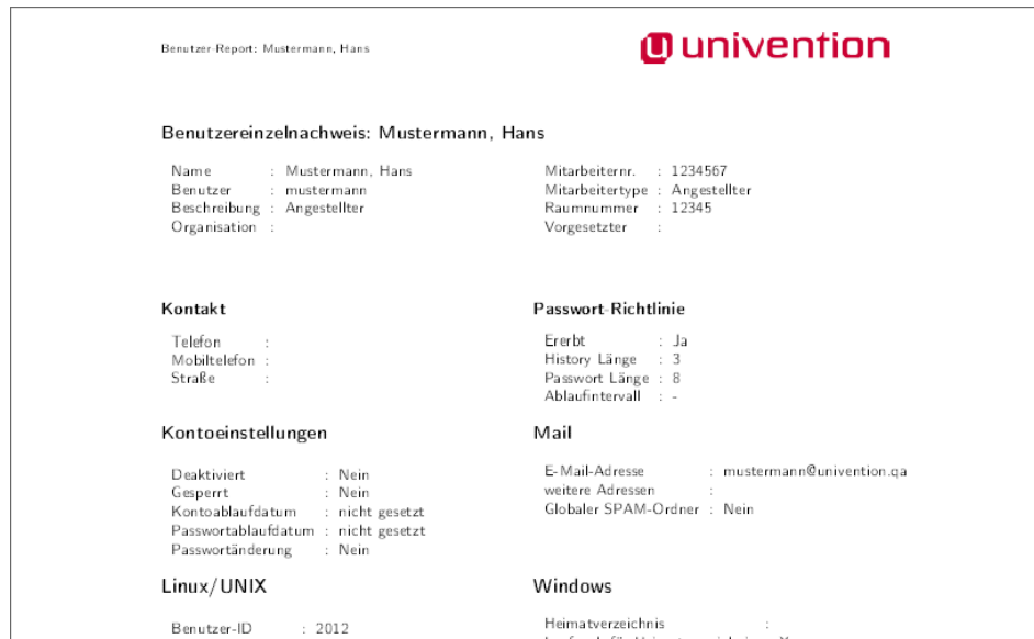
Abbildung 1: Beispiel eines PDF-Reports

Univention Directory Reports bietet die Möglichkeit vordefinierte Reports zu beliebigen im Verzeichnisdienst verwalteten Objekten zu erstellen.