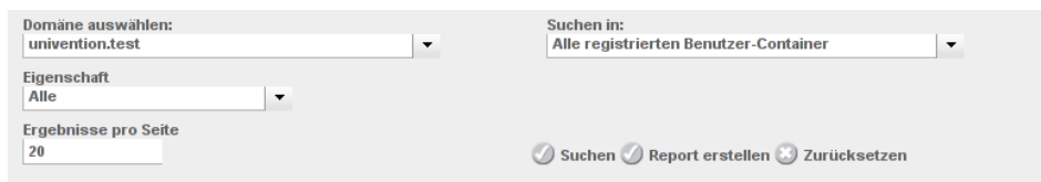
Abbildung 2: Erweiterter Suchdialog

Die Funktion zur Erstellung von Reports ist in die Assistenten des Univention Directory Manager integriert. Im Untermenü Suchen gibt es eine Schaltfläche [Report erstellen] , die angezeigt wird, wenn für die Univention Directory Manager Module, die durch den Assistenten verwaltet werden, Reportvorlagen definiert sind (siehe Abbildung 2).